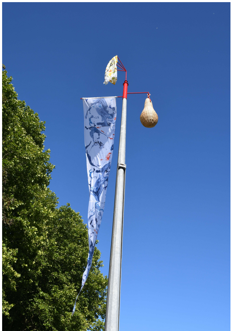
Akène en sortie du port de Migennes

Avec «Rumeur en froissement» de P.A. REMY, à l'entrée de l'écluse et Akène de M. CLASS à la sortie du port, ils créent un langage poétique, un nouvelle signalétique, que chacun pourra interpréter à sa guise.