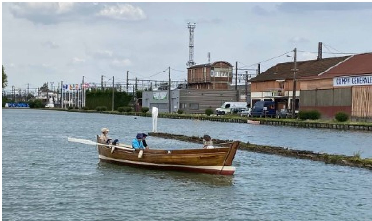
Essai de la baleinière sur le port du canal.