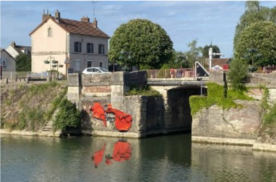
Rumeur en froissement, à proximité de l'écluse de l'Yonne

Avec «Rumeur en froissement» de P.A. REMY, à l'entrée de l'écluse et Akène de M. CLASS à la sortie du port, ils créent un langage poétique, un nouvelle signalétique, que chacun pourra interpréter à sa guise.