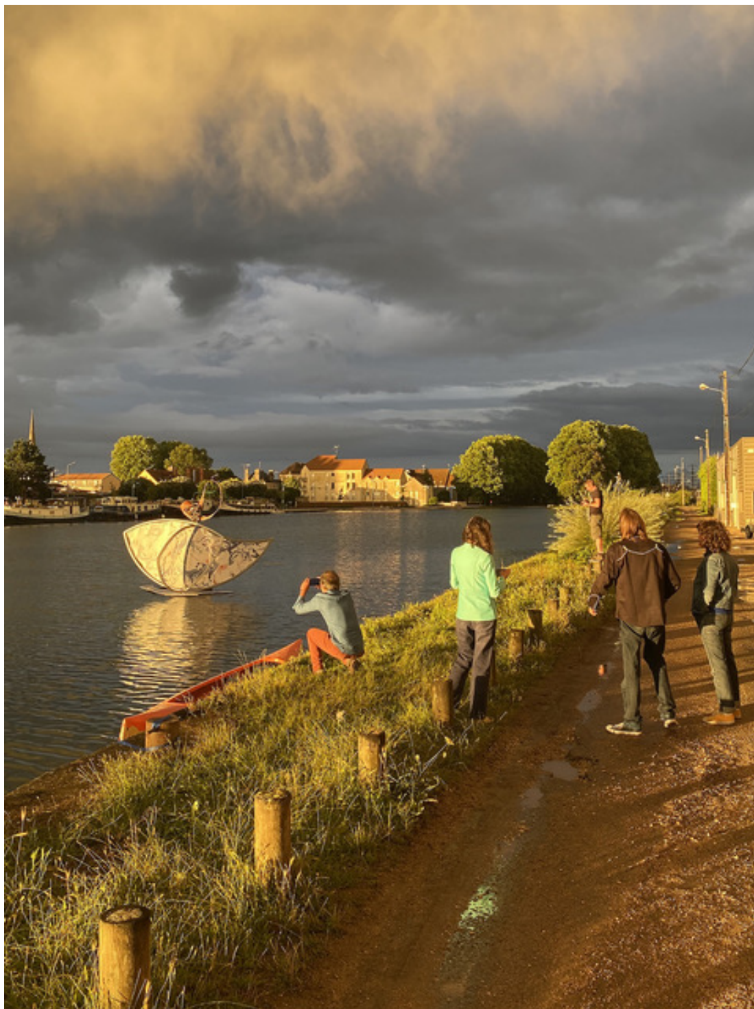
ESTOMOBAL devant Canal Satellite Art Contemporain Migennes

ESTOMOBAL : N'ayant pas l'habitude d'œuvrer ensemble, ils ont choisi le principe du cadavre exquis. Chacun, à tour de rôle apporte une idée, comme un jeu, un temps de vacances. Il en résulte un mix de tous les matériaux et techniques avec lesquels chacun travaille : Impression sur toile, céramique acier, osier,... La plupart des pièces a été construite en atelier et assemblée sur place.