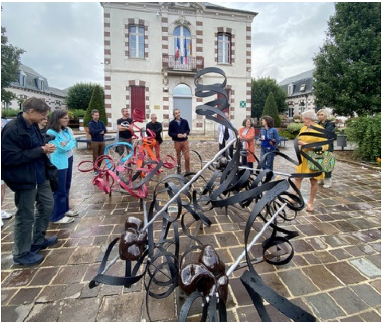
À tour de bras, devant la Mairie de Migennes.

« A TOUR DE BRAS », action de mettre en forme la matière. Il s'agit de deux pièces d'une série créée pour la Friche de la Belle de Mai à Marseille. Le nombre 2 a été choisi pour symboliser leur tandem.